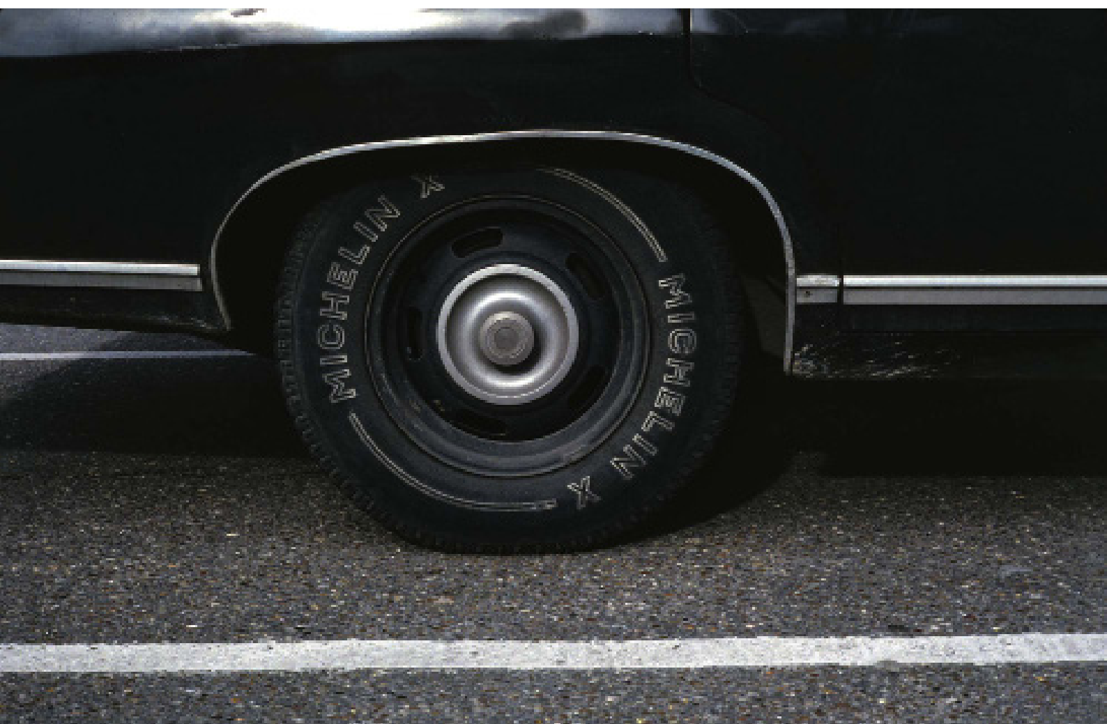
On the road #1, Paris 1889