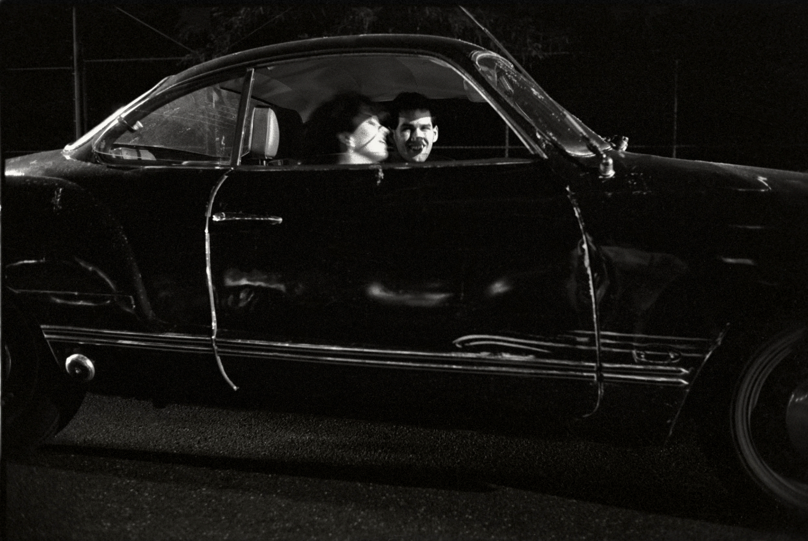
The love #3 / New York 1996