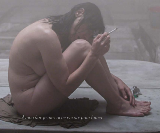
À mon âge je me cache encore pour fumer

Prix du public au Festival de Thessalonique 2016.