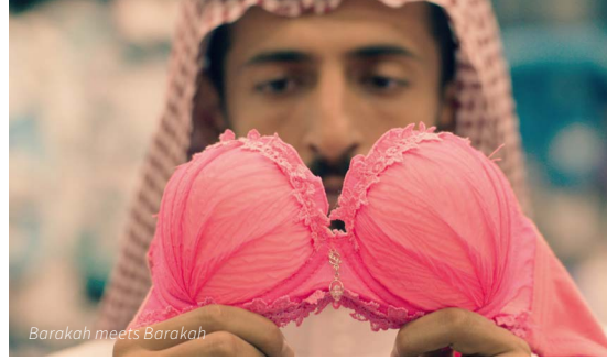
Barakah meets Barakah