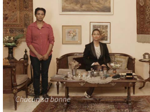
Chacun sa bonne