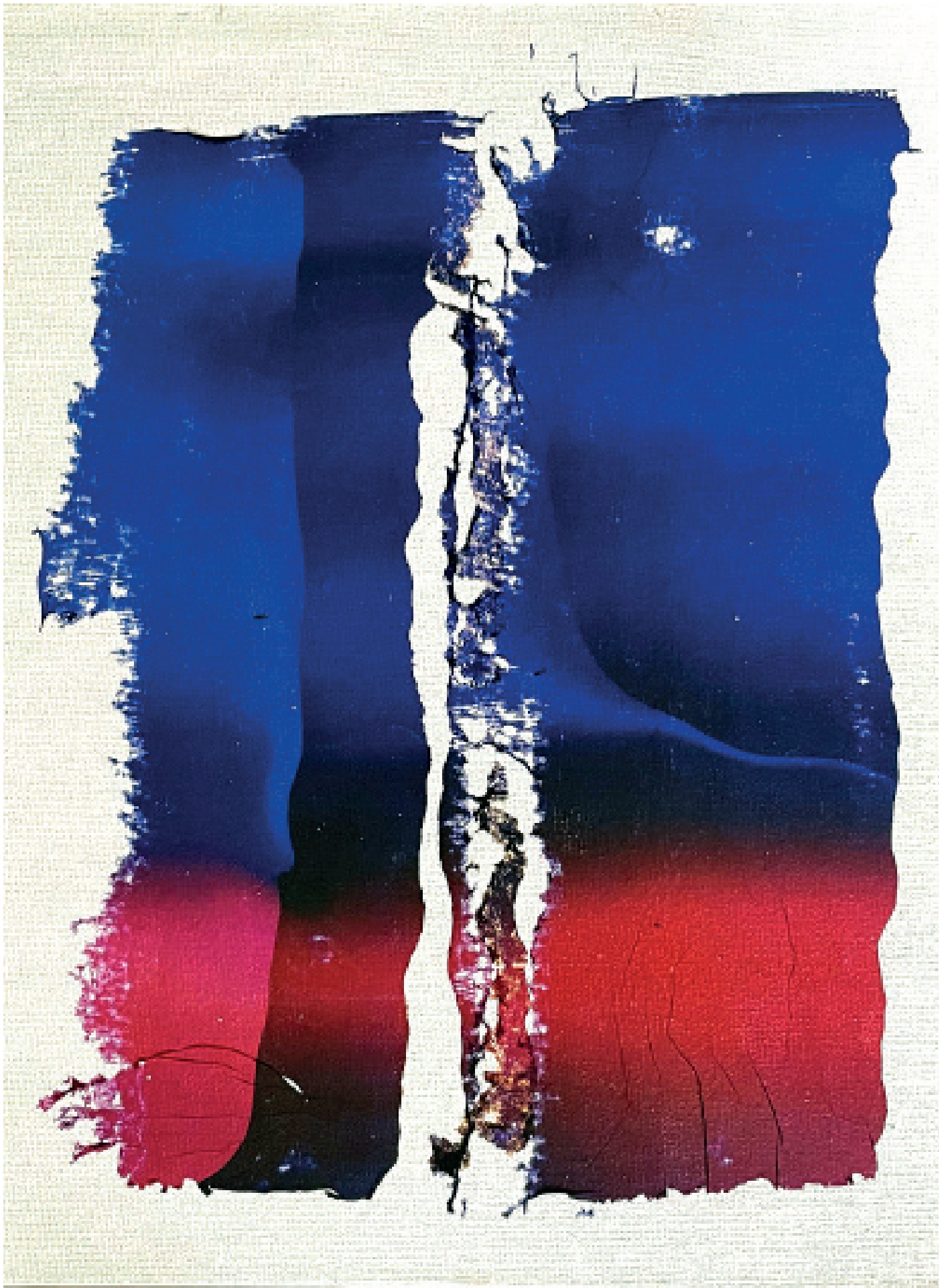
Emulsion sur toile 2022 ©Ibn El Farouk