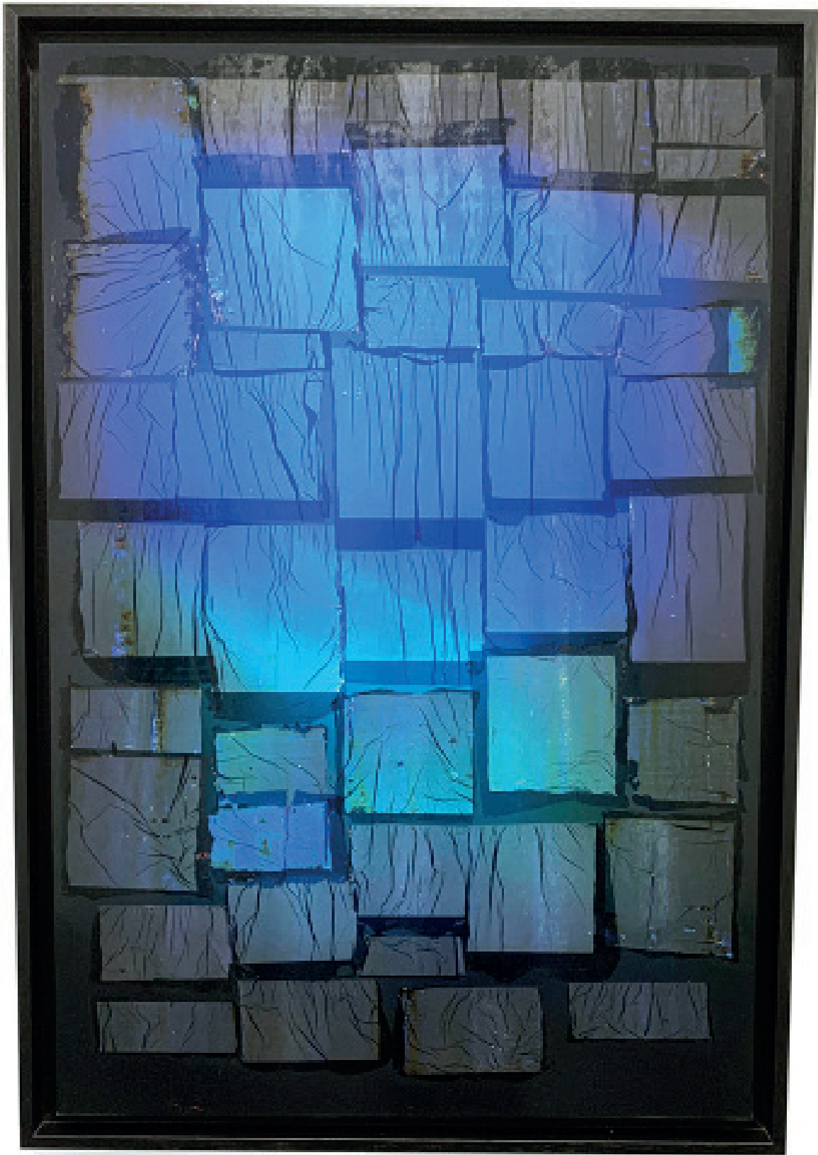
Palimpsest #1, 2022 Chromogène Fujicolor Crystal Archive paper 75 x 50 cm - Pièce unique ©Ibn El Farouk