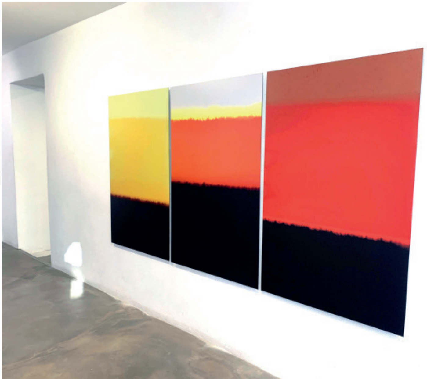
Beginning 35, #1, #2, #3, 2018 Epreuve à plat U.V. 125 x 80 cm - Edition 5 + 2EA ©Ibn El Farouk