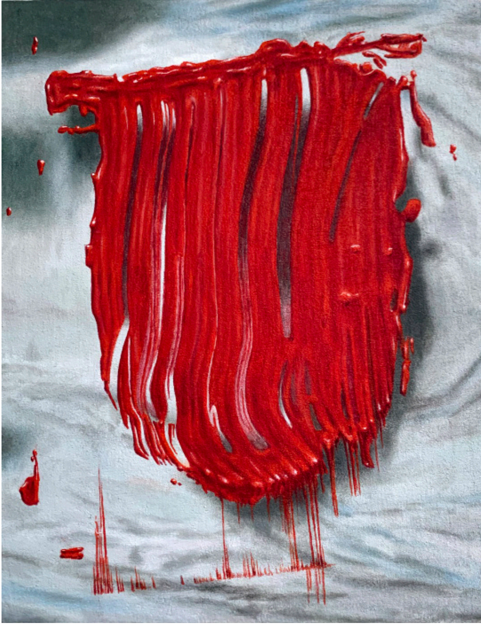
Sans titre acrylique sur toile 40 x 50 cm 2023 ©Kacem Noua