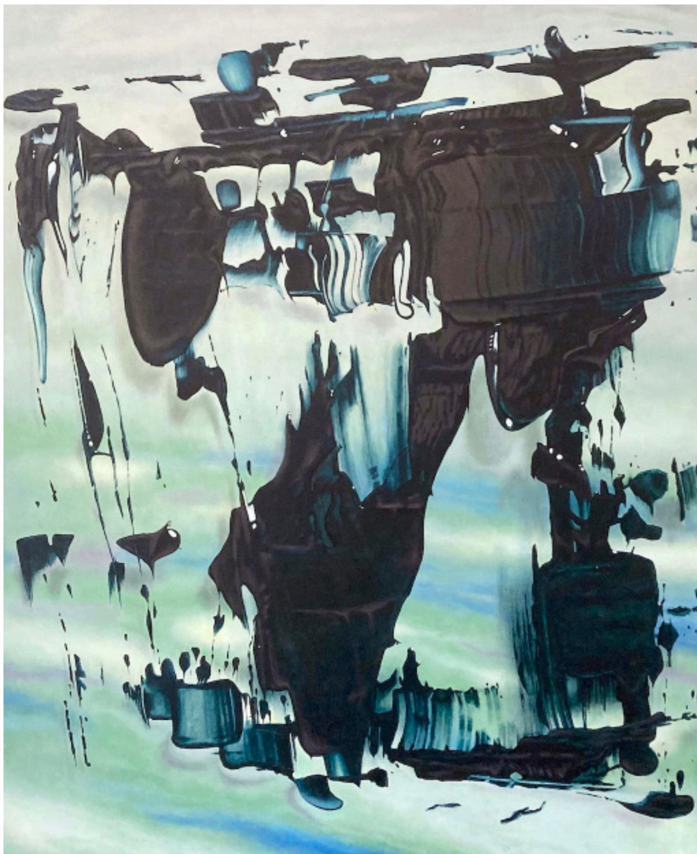
Sans titre acrylique sur toile, châssis en aluminium 160 x 200 cm 2023 ©Kacem Noua