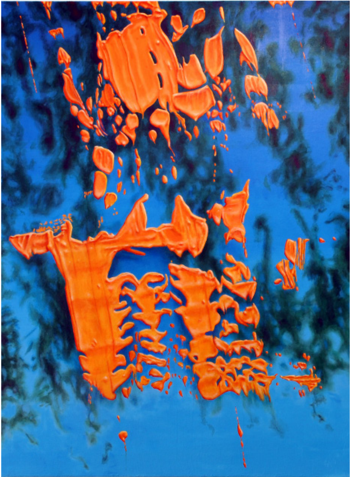
La contribution du colibri acrylique sur toile, châssis en aluminium 120 x 180 cm ©Kacem Noua