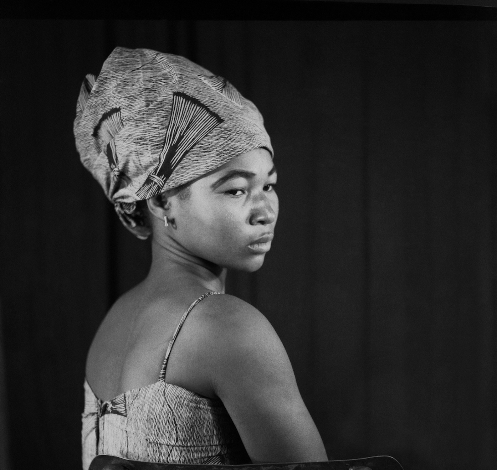
Sans titre. Série Podor, 1963-1978