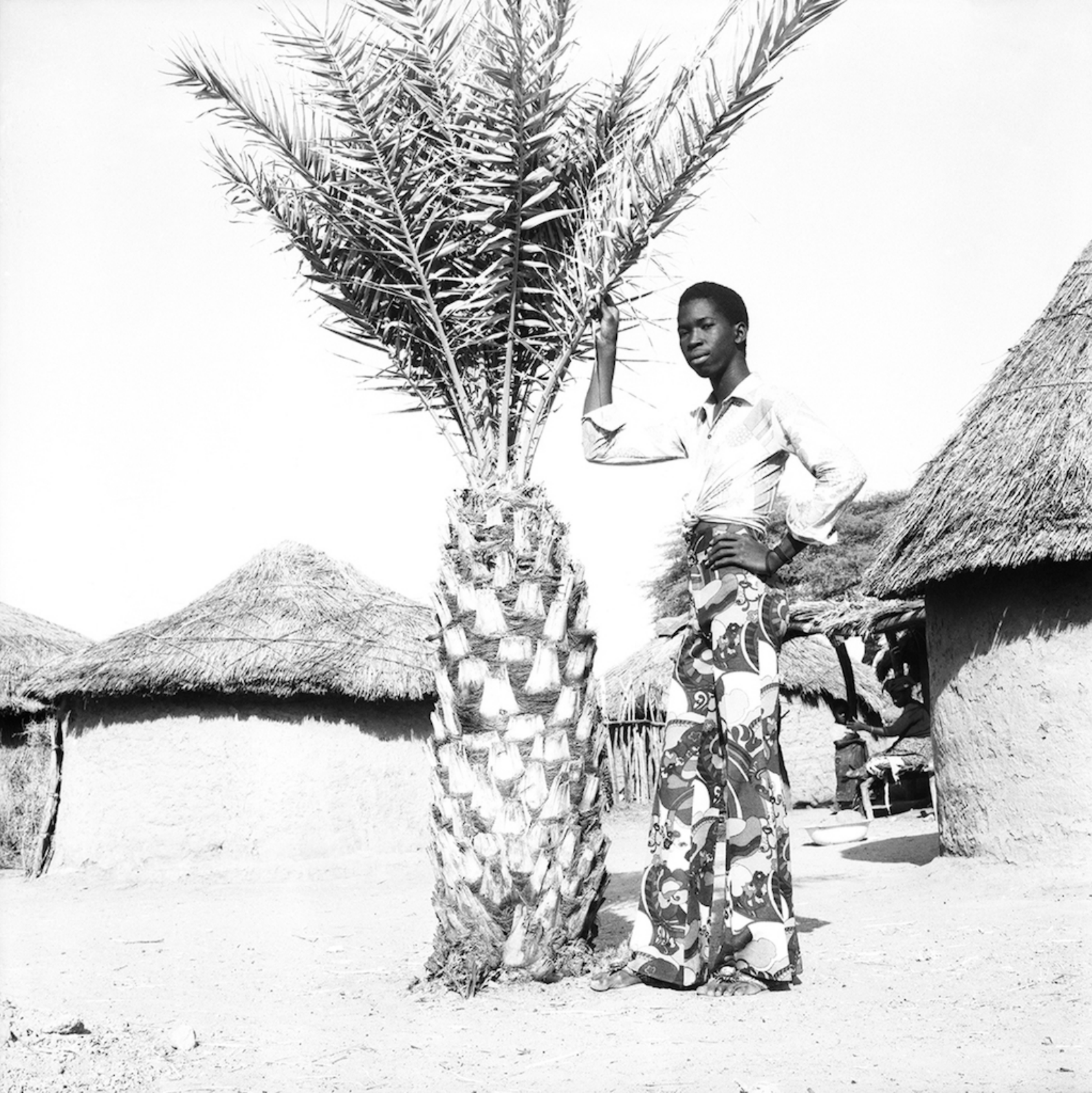
Sans titre. Série Podor, 1963-1978