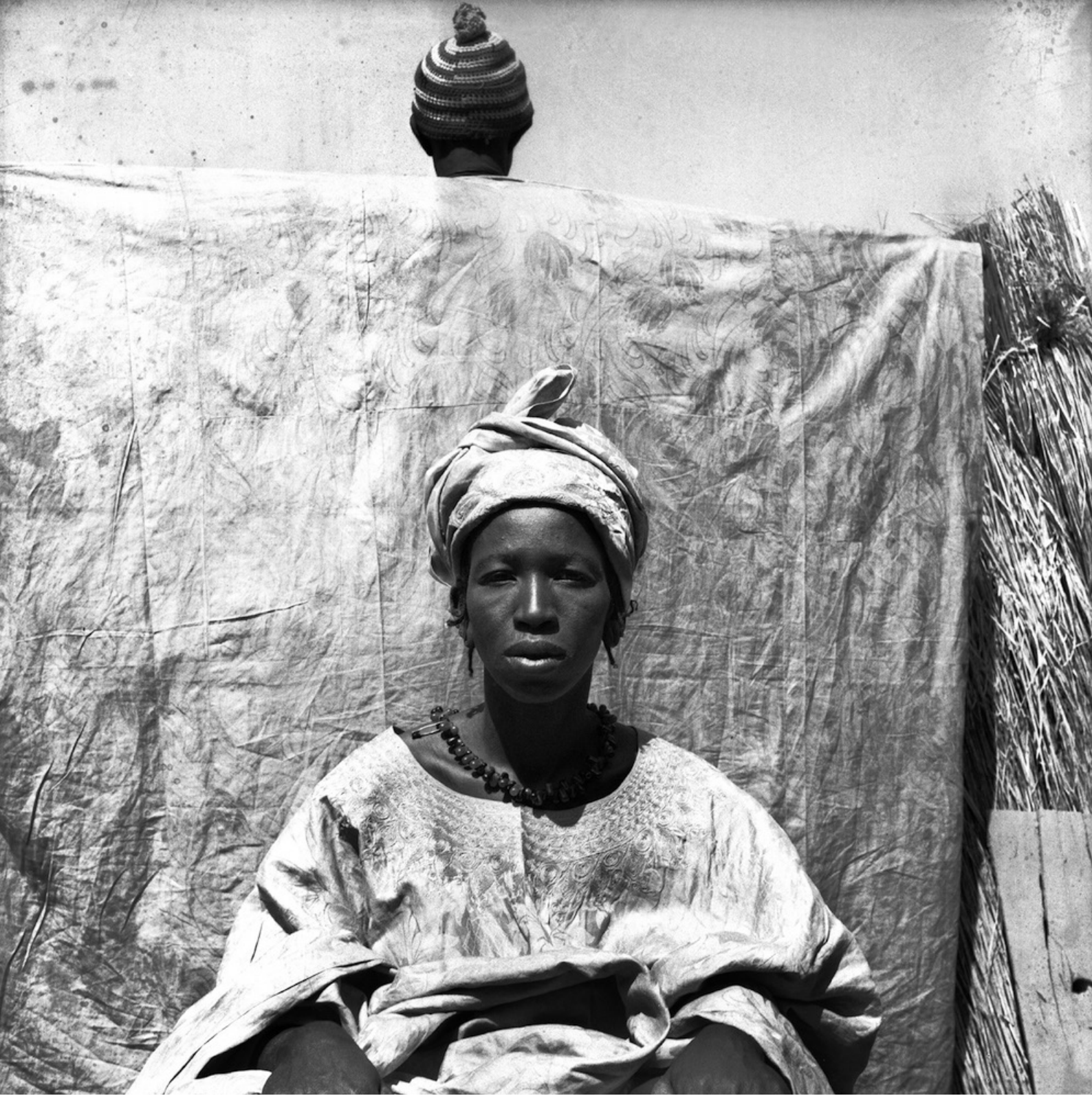
Sans titre. Série Podor, 1963-1978