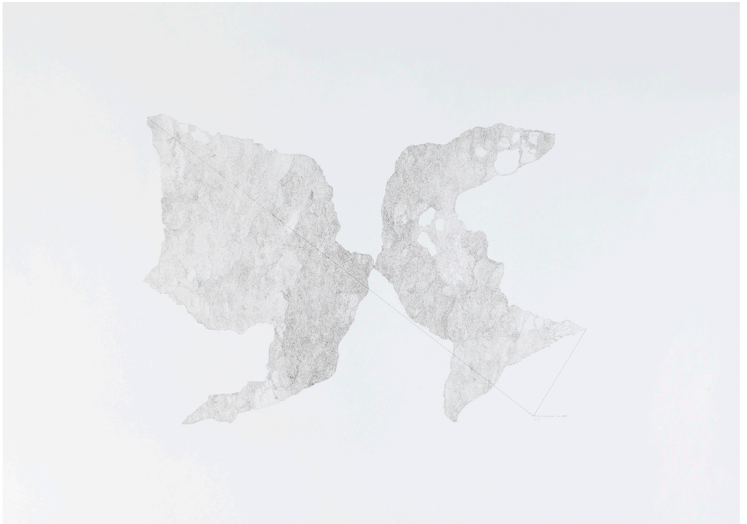
Dessin au métronome, protocole I, #2, feutre pigmentaire et métronome, 100cm x 65 cm, 2016 © Haythem Zakaria