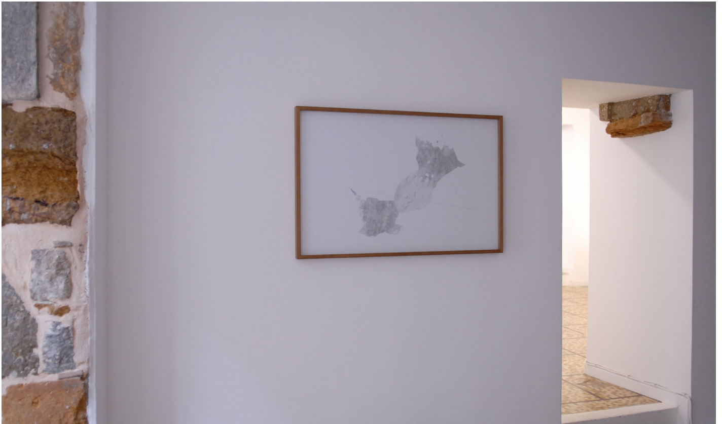
Dessin au métronome protocole I #1, feutre pigmentaire et métronome, 100 x 65 cm, 2016 © Haythem Zakaria